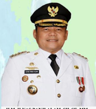
H.M. ILYAS PANJI ALAM, SH. SE, MM BUPATI OGAN ILIR

PAYARAMAN KONFIRMASI : 3 MENINGGAL : 0 SEMBUH : 3 SUSPEK : 23 PROBABLE : 0