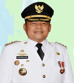
H.M. ILYAS PANJI ALAM, SH, SE, MM BUPATI OGAN ILIR

LUBUK KELIAT KONFIRMASI : 0 MENINGGAL : 0 SEMBUH : 0 SUSPEK : 10 PROBABLE : 0