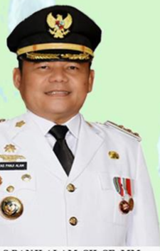
H.M. ILYAS PANJI ALAM, SH, SE, MM BUPATI OGAN ILIR

LUBUK KELIAT KONFIRMASI : 0 MENINGGAL : 0 SEMBUH : 0 SUSPEK : 10 PROBABLE : 0