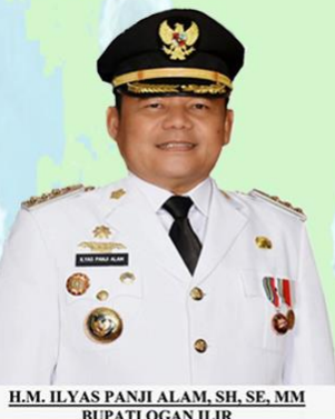
H.M. ILYAS PANJI ALAM, SH, SE, MM BUPATI OGAN ILIR

LUBUK KELIAT KONFIRMASI : 0 MENINGGAL : 0 SEMBUH : 0 SUSPEK : 10 PROBABLE : 0