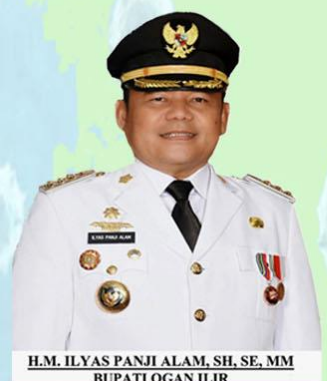
H.M. ILYAS PANJI ALAM, SH, SE, MM BUPATI OGAN ILIR

LUBUK KELIAT KONFIRMASI : 0 MENINGGAL : 0 SEMBUH : 0 SUSPEK : 10 PROBABLE : 0