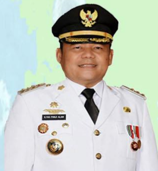
H.M. ILYAS PANJI ALAM, SH, SE, MM BUPATI OGAN ILIR

PAYARAMAN KONFIRMASI : 3 MENINGGAL : 0 SEMBUH : 3 SUSPEK : 23 PROBABLE : 0