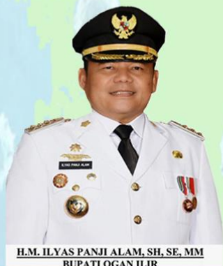
H.M. ILYAS PANJI ALAM, SH, SE, MM BUPATI OGAN ILIR

LUBUK KELIAT KONFIRMASI : 0 MENINGGAL : 0 SEMBUH : 0 SUSPEK : 10 PROBABLE : 0